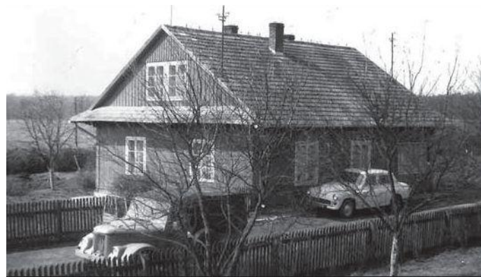
Leśniczówka Leśnictwa Przyjemek wybudowana w 1958r. Zdjęcie z dnia 01.01.1979r.