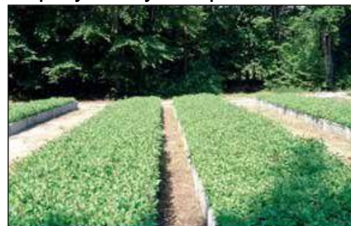
Produkcja sadzonek w inspektach w 2003 roku