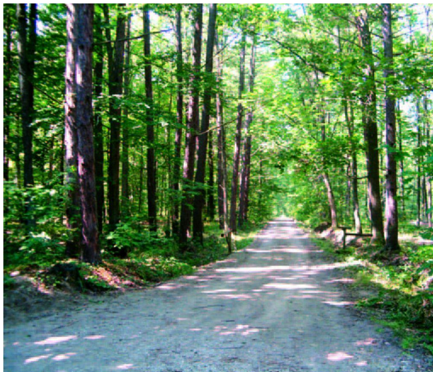
Utwardzona droga „Kolejka” w Leśnictwie Chrapy