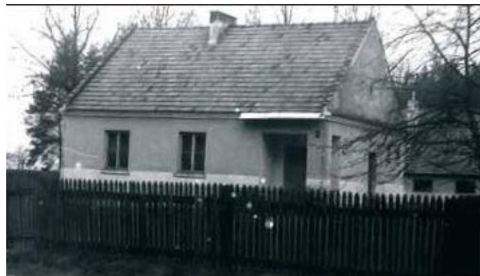
Leśniczówka Leśnictwa Czerwona Wola wybudowana w 1961 roku. Zdjęcie z dnia 01.01.1979r.