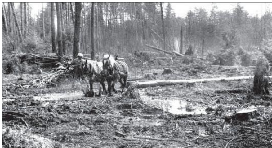
Zrywka drewna (wleczona) na powierzchni pohuraganowej w Leśnictwie Zaradawa.

W okresie tym następuje częściowa mechanizacja prac leśnych