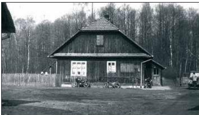
Leśniczówka Leśnictwa Witoldówka wybudowana w 1953 roku, obecnie nie istniejąca. Zdjęcie z dnia 01.01.1979r