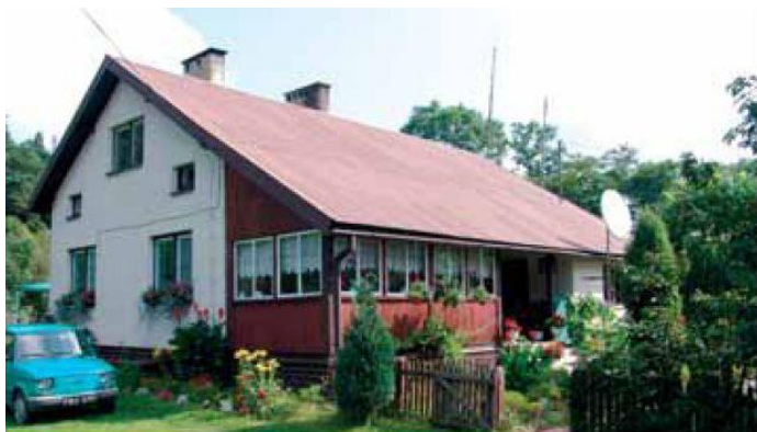
Leśniczówka Leśnictwa Majdan w 2013 roku