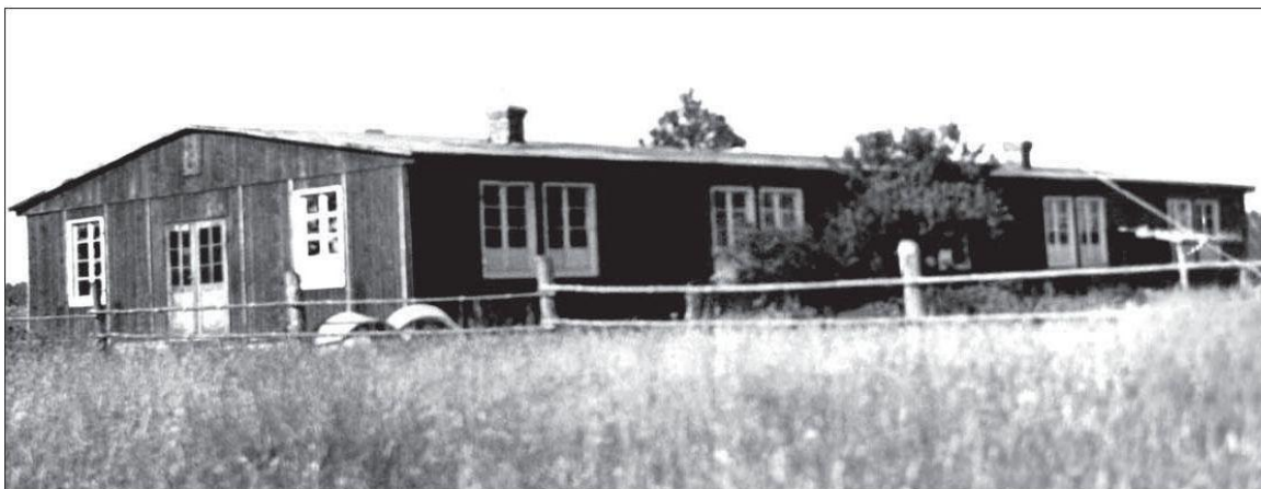
Hotel robotniczy „Kopań” do zakwaterowania robotników werbowanych