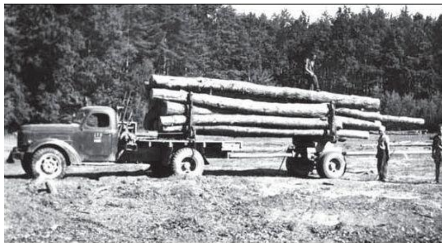
Jeden z pierwszych samochodów przy mechanicznym wywozie drewna.