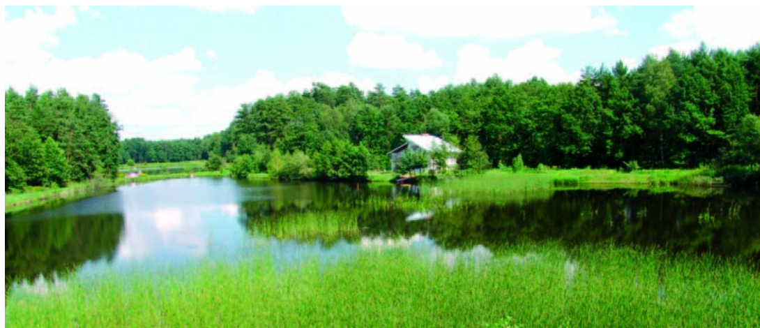
Kompleks stawów w Leśnictwie Kot