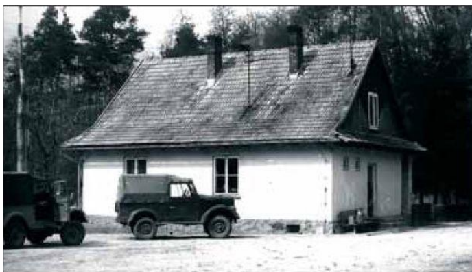
Leśniczówka Leśnictwa Chrapy wybudowana w 1961 roku. Zdjęcie z dnia 01.01.1979r.