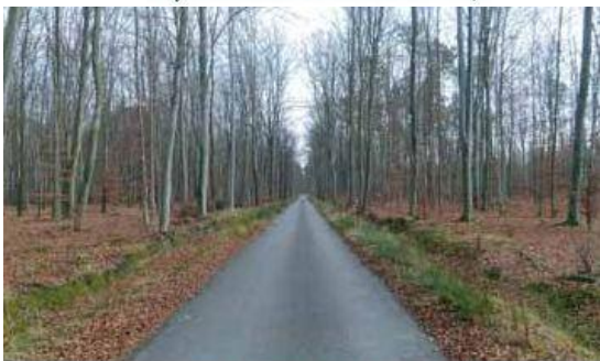
Asfaltowa droga nr 5 „Radawska” w Leśnictwie Czercze