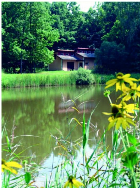
Kompleks stawów w Leśnictwie Pawłowa