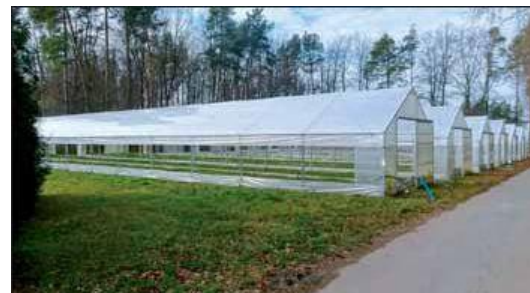
Produkcja sadzonek w warunkach kontrolowanych