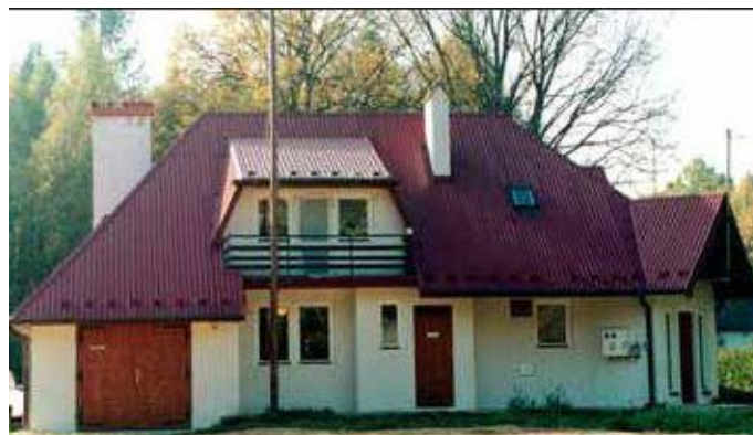
Leśniczówka Leśnictwa Witoldówka z 1999 r. Zdjęcie z 2012r.