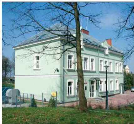
Budynek biura Nadleśnictwa Siemiawa w 2014 r.