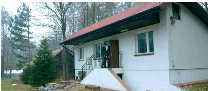
Zaplecze leśnictwa Szkółkarskiego w Pawłowej z 1996 r. Zdjęcie z 2014 r.