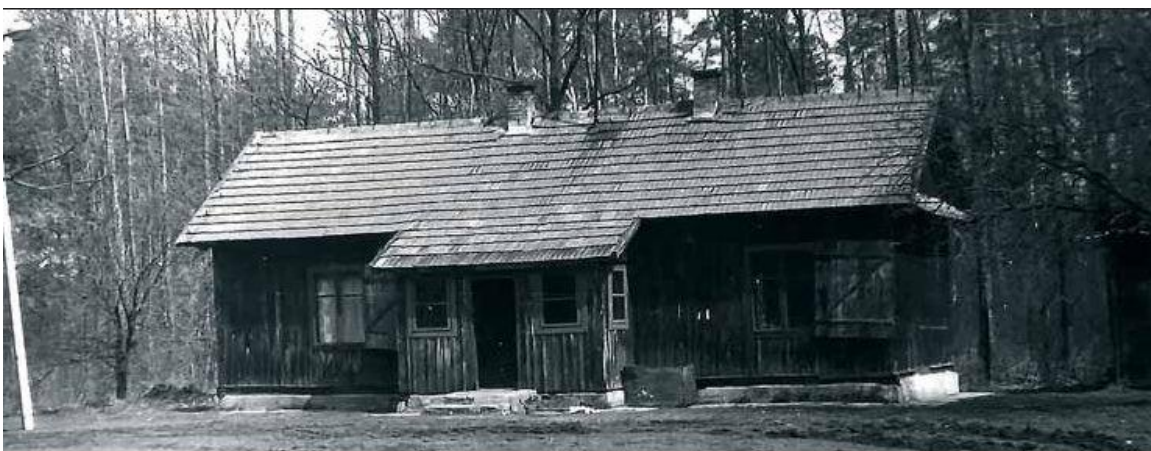
Hotel robotniczy w Leśnictwie Przyjemek wybudowany w 1951 roku, obecnie nie istniejący. Zdjęcie z dnia 01.01.1979r.