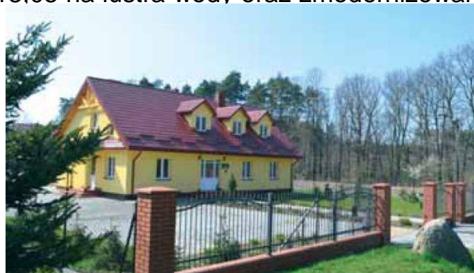
Leśniczówka Leśnictwa Chrapy w 2014 r.